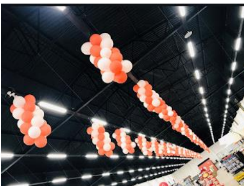
Pinjentes de lojas.