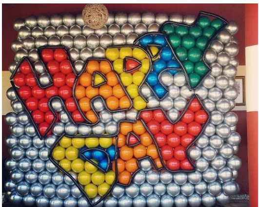
Projeto e execução: Edilania Coutinho, recepção de evento.