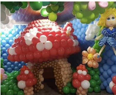
Projeto seminário Salvador/Ba